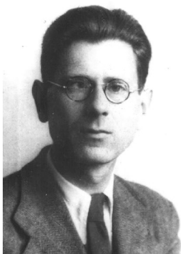
В. Л. Крейцер

Бравко Н. О. (1900–1972) – с 1938 г. кинорежиссер, режиссер высшей категории музыкальных передач [10].