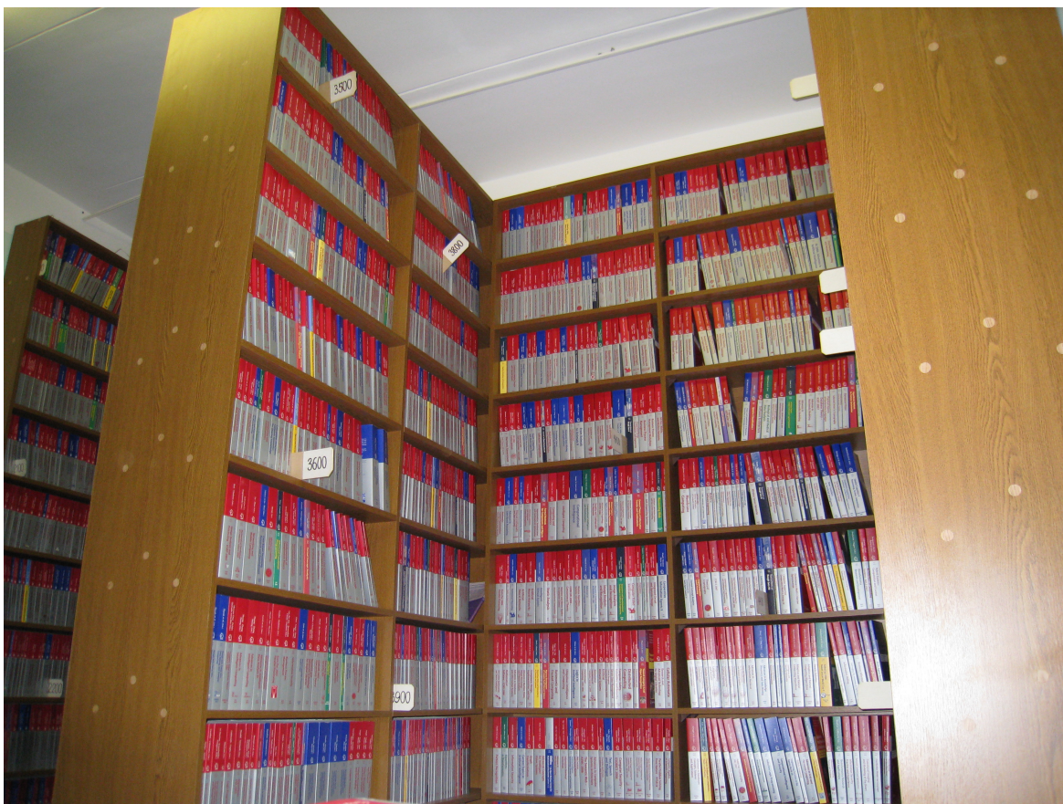
Рис. 2. Библиотека. На полках тома Lecture Notes in Computer Science